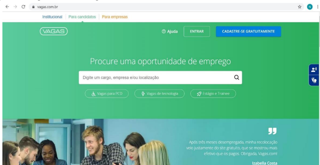
Figura 1- Página do site Vagas.com

O site do vagas.com possui uma interface bastante objetiva e atrativa, deixando claro o propósito do site, tanto para os candidatos quanto para as empresas, não há dificuldades de acesso, o conteúdo é estruturado para os usuários encontrarem o que precisam, a figura 1 mostra a página inicial do site Vagas.com.