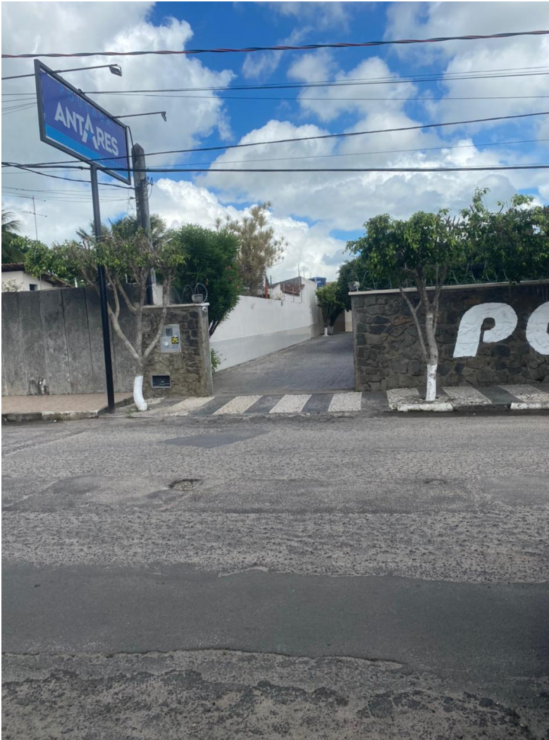
Imagem 08 - Foto do estabelecimento Pousada Antares