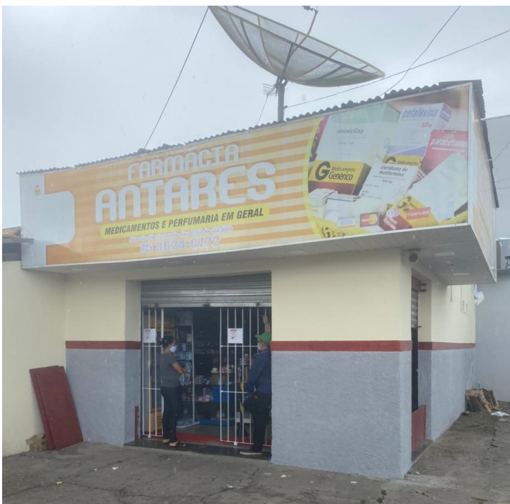
Imagem 10 - Foto do estabelecimento Farmácia Antares- Medicamentos e Perfumaria em Geral