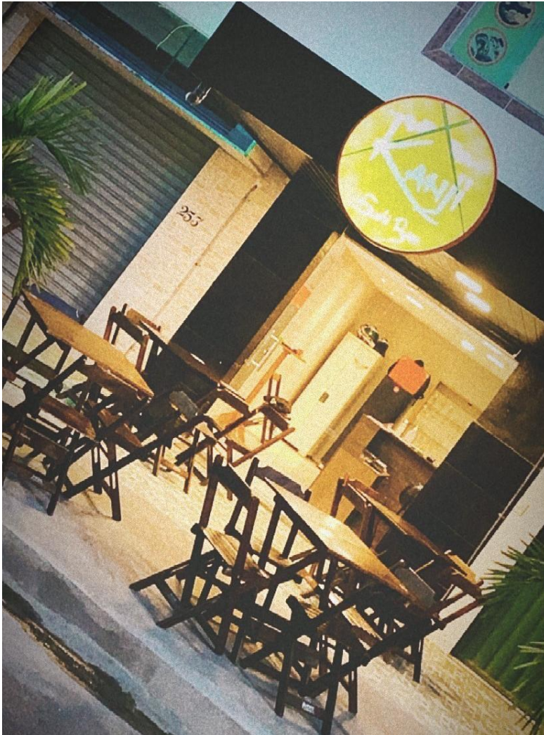
Imagem 07 - Foto do estabelecimento Kanji Sushi Bar