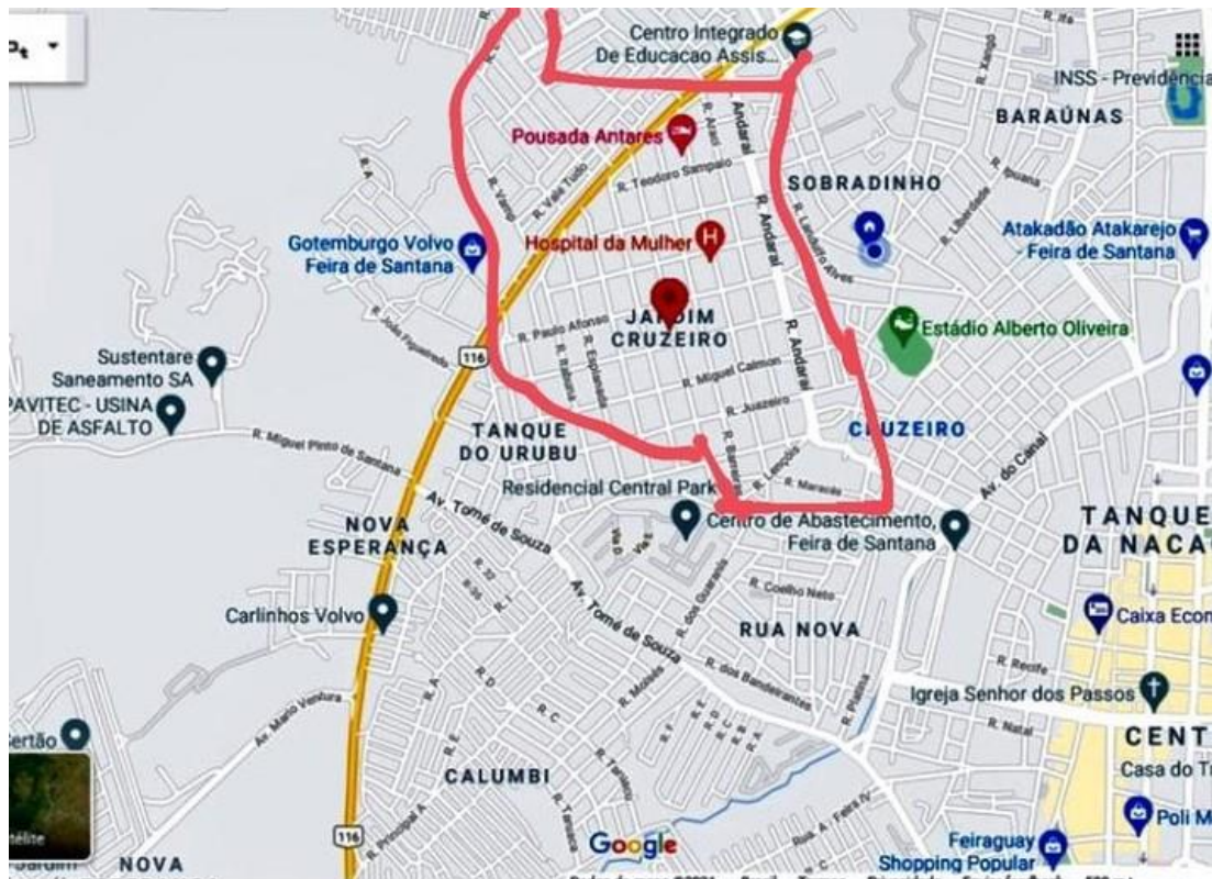
Imagem 04 – Representação Geográfica do bairro Jardim Cruzeiro.