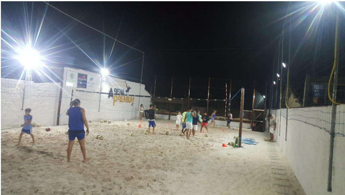
Imagem 02 - Foto interna da Arena, de alunos jogando.