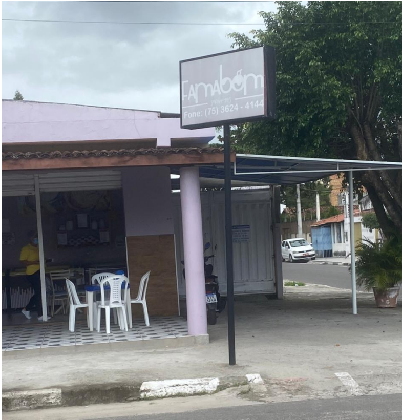
Imagem 09 - Foto do estabelecimento Sorveteria Fama Bom