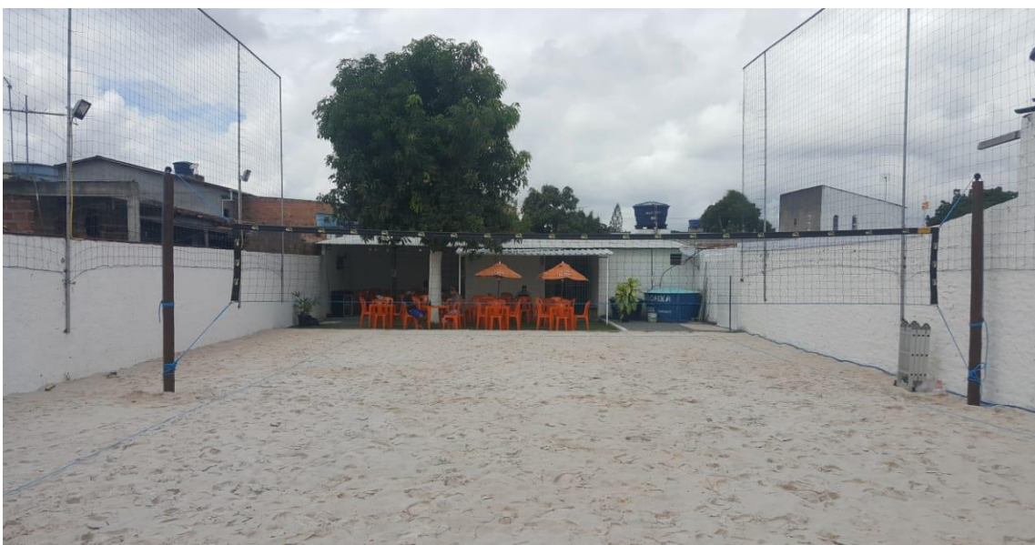
Imagem 03 - Foto interna da Arena, com orientação para a parte do restaurante.